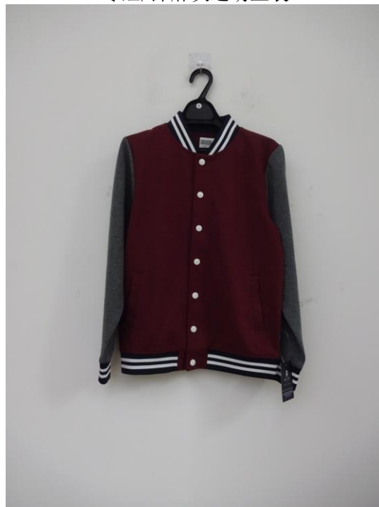
枣红/深麻灰运动上装