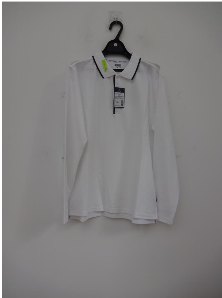
白色 T 恤